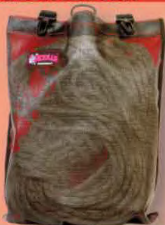
▲ Bolsa cuerda de socorro Cap.: 60m. (9 mm.)