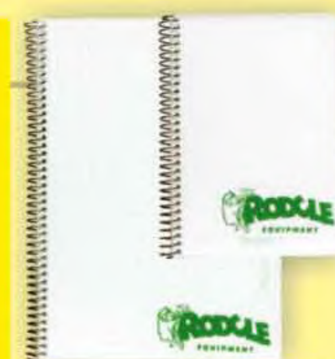
▲ Agua A5