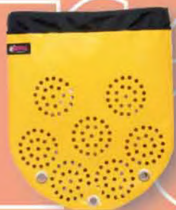
▲ Sera Cap.: 60m. (10mm.) BOLSA RÁPIDA