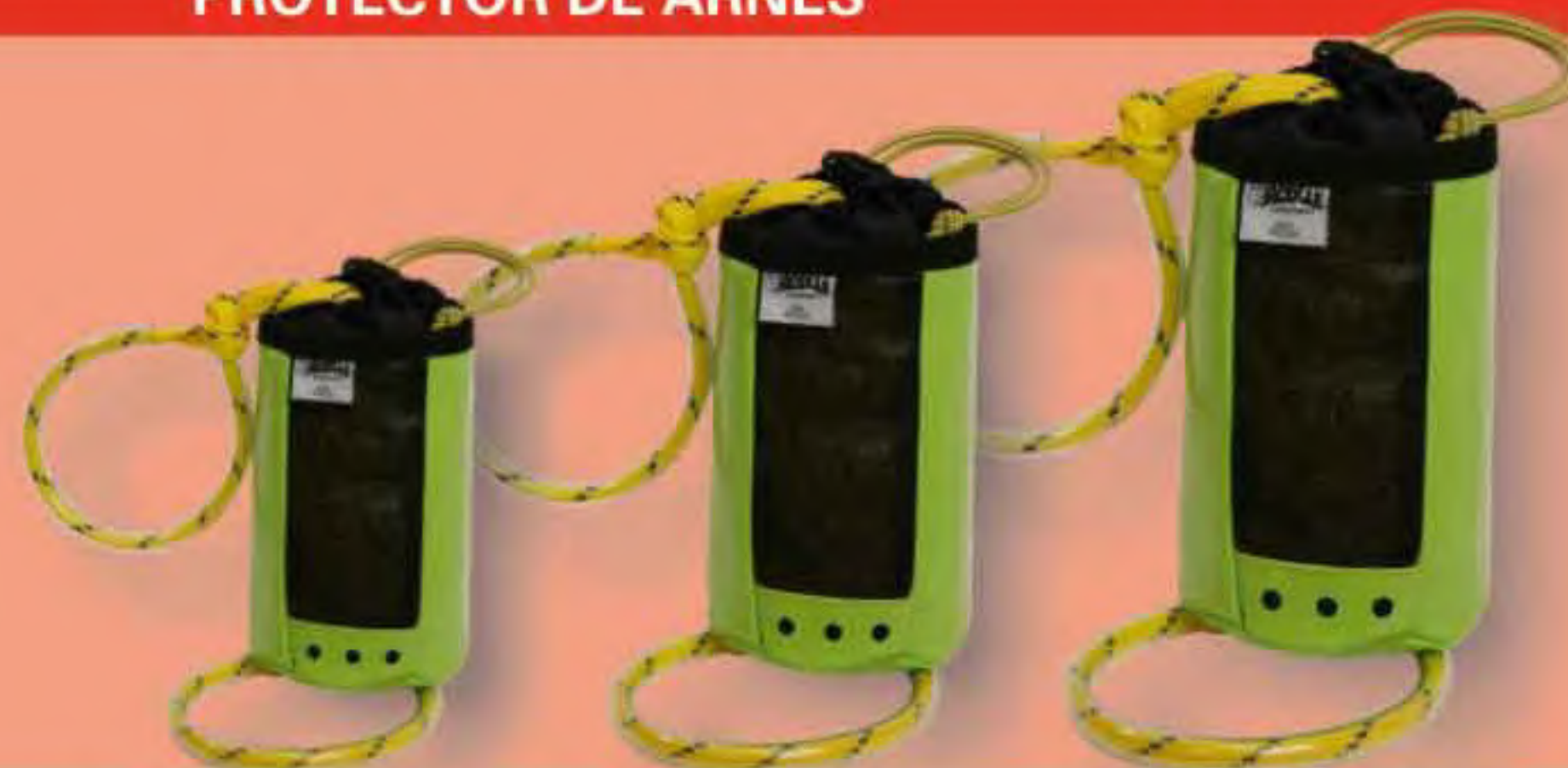
▲ Rescues 15 L.: 15m.