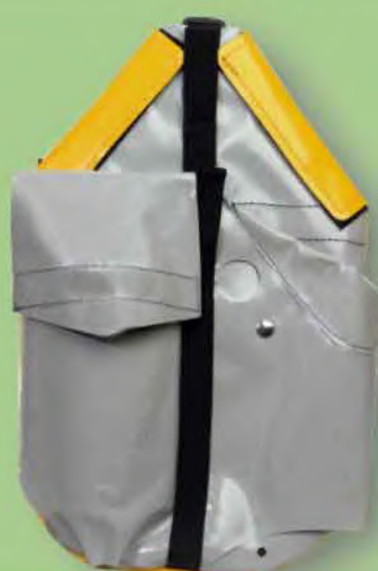
▲ Barraca II