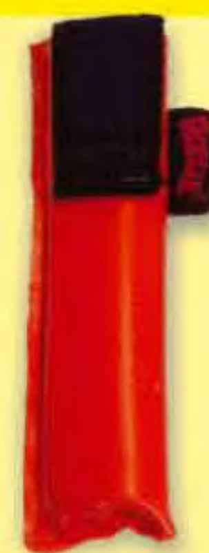
▲ 9,8 PORTACUÑAS