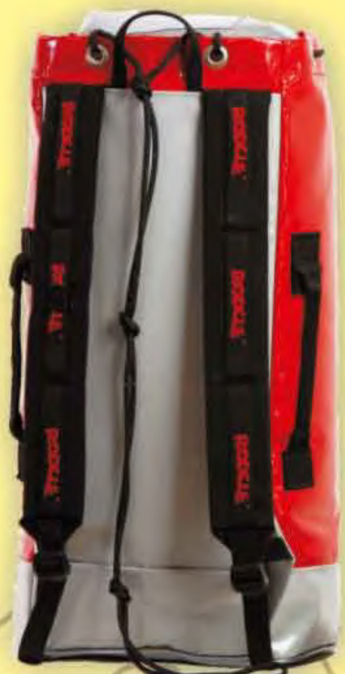
▲ Alba P-541 Base ∅: 21x30 cm.; H: 61 cm.; Cap.: 41 Lit.