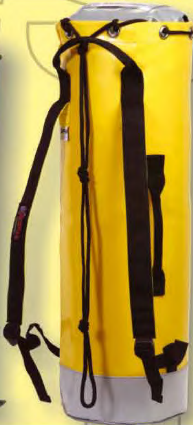
▲ Extra P-431 Base ∅: 23 cm. H: 70cm.; Cap.: 31 Lit.