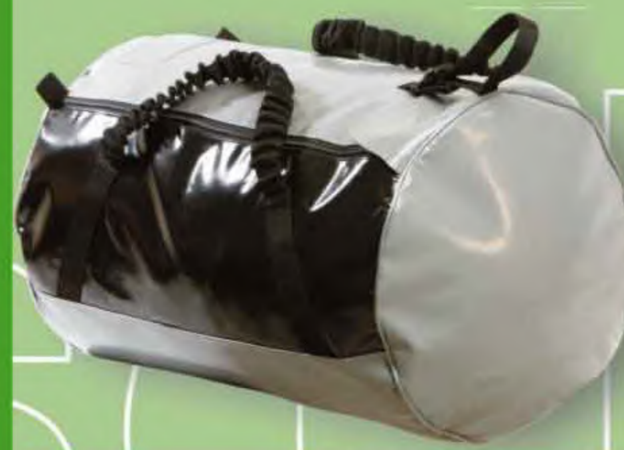
▲ BI 75 Ø: 40 cm.; H: 40 cm.; Cap.: 75 Lit.; L: 61 cm. P: 1190 gr.