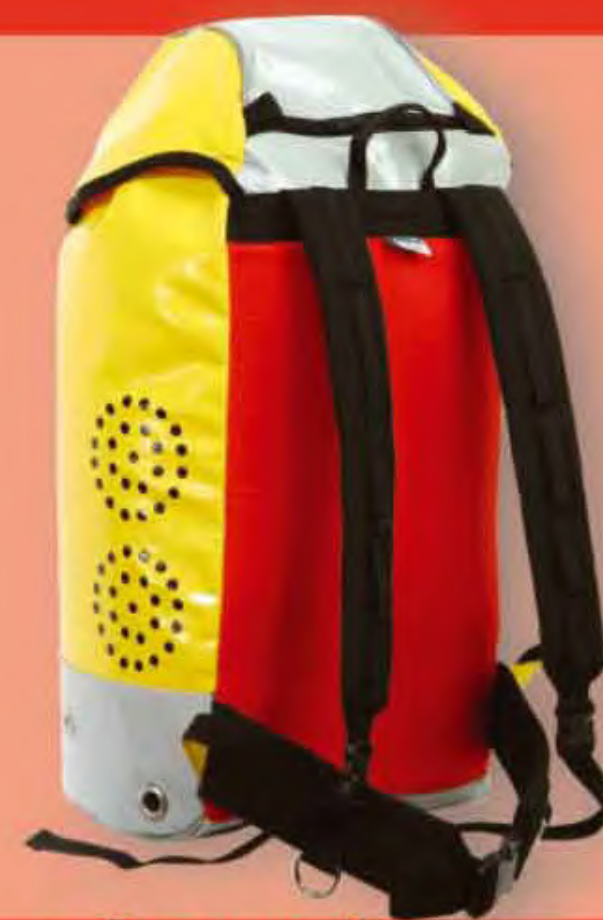
▲ Consusa 45 Base: 32x29 cm.; H: 58 cm.; Cap.: 45 Lit.