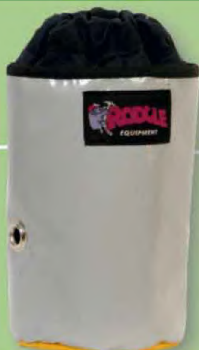
▲ Recuperación 50 BOLSA CORDELETTE