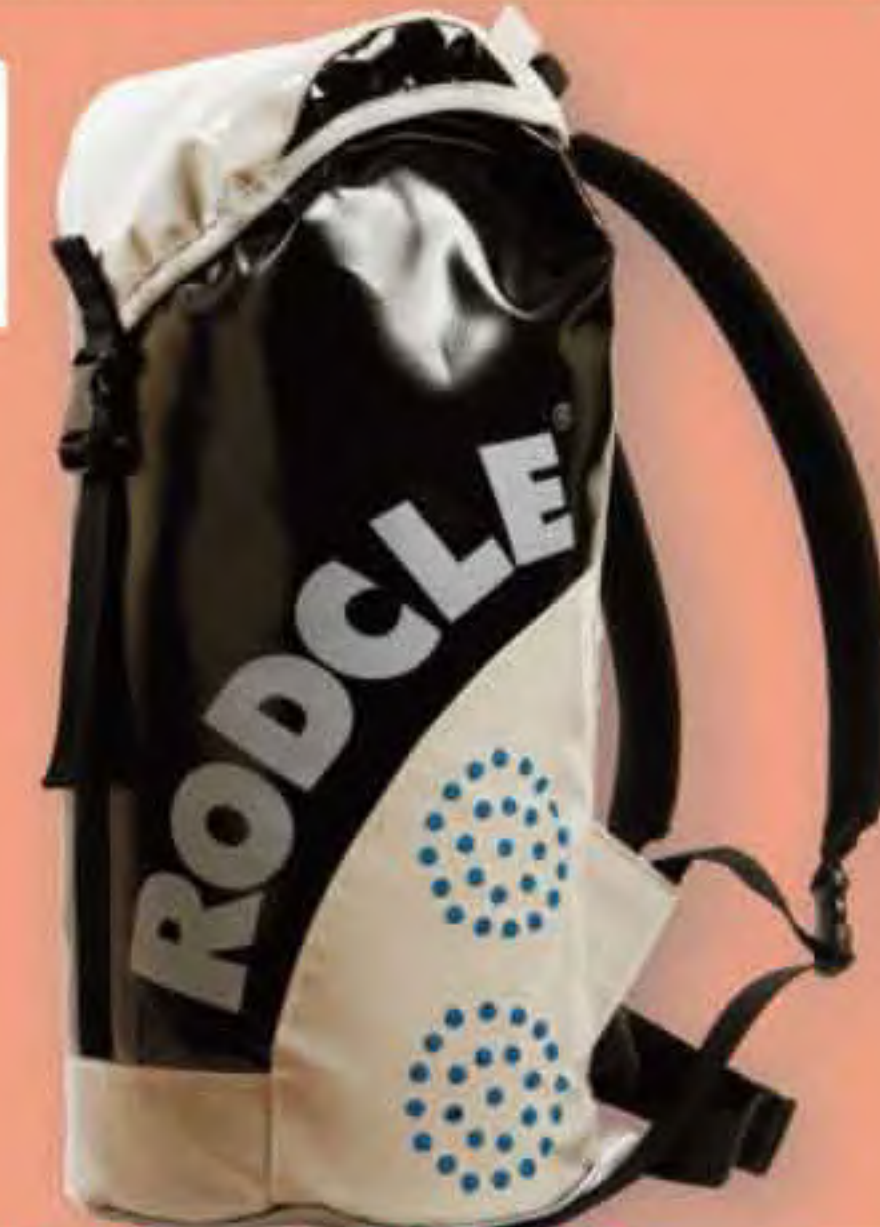
▲ Gorgonchón 35 Base: 30x22 cm.; H: 58 cm.; Cap.: 35 Lit.