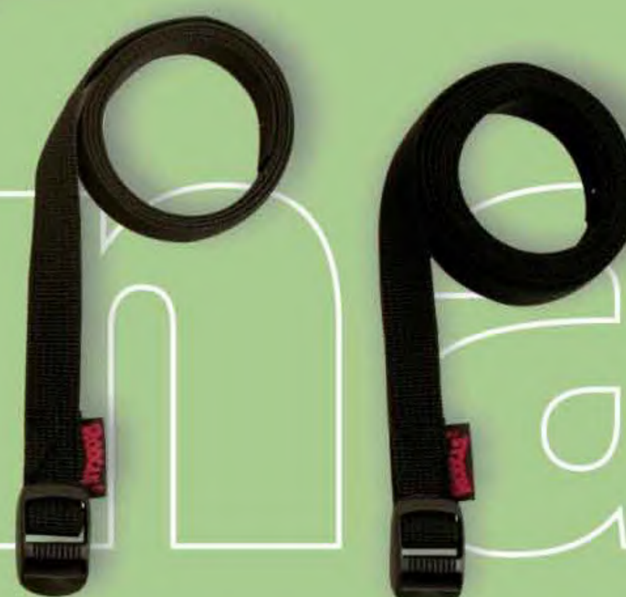
▲ Sujeta 120 2 x 120 cm.