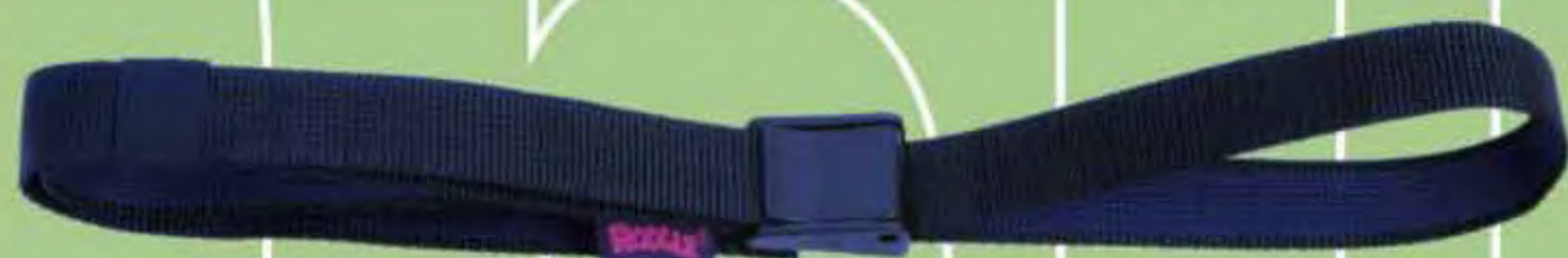
▲ HPCB 120: 2,5 x 120 cm. HPCB 150: 2,5 x 150 cm.