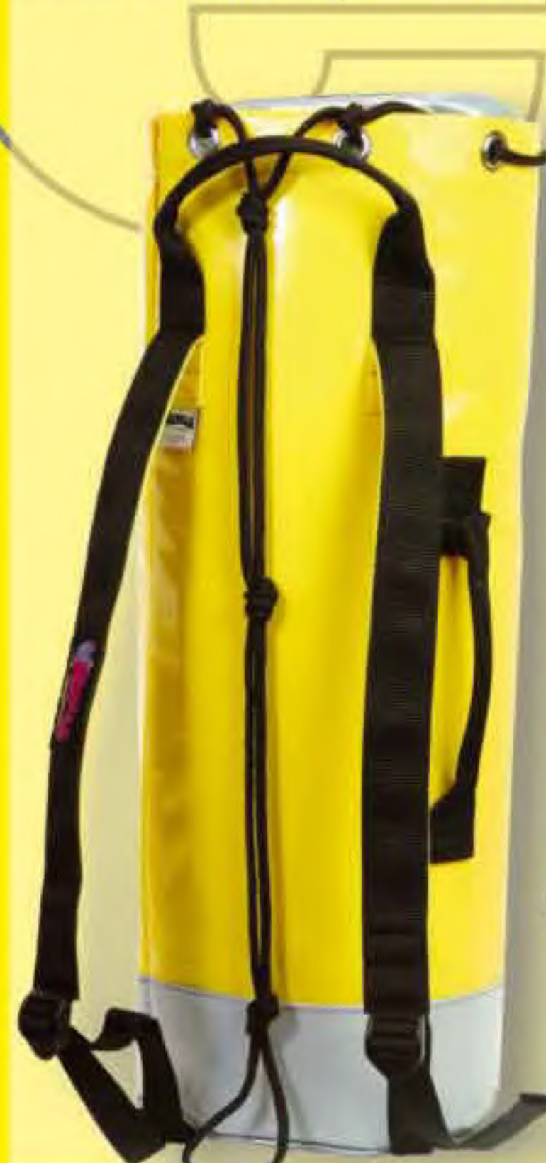
▲ Picos P-327 Base ∅: 23 cm. H: 62 cm.; Cap.: 27 Lit.