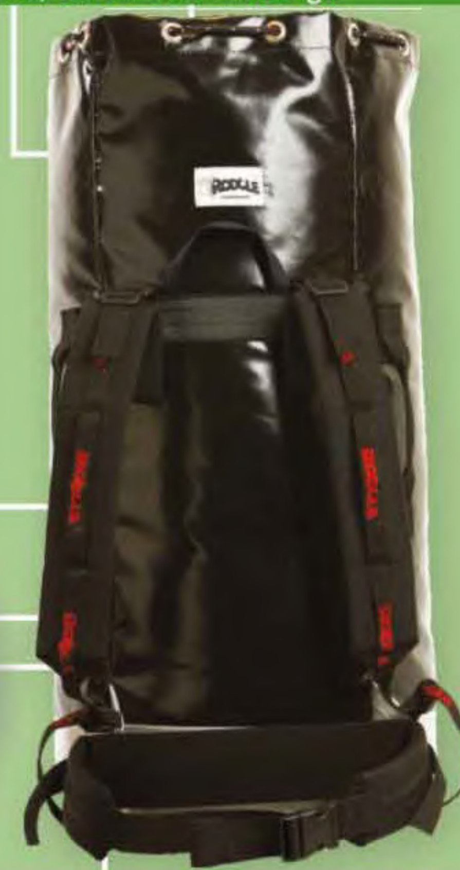
▲ Expedition World Base Ø: 40 cm.; H: 80 cm.; Cap.: 105 Lit.