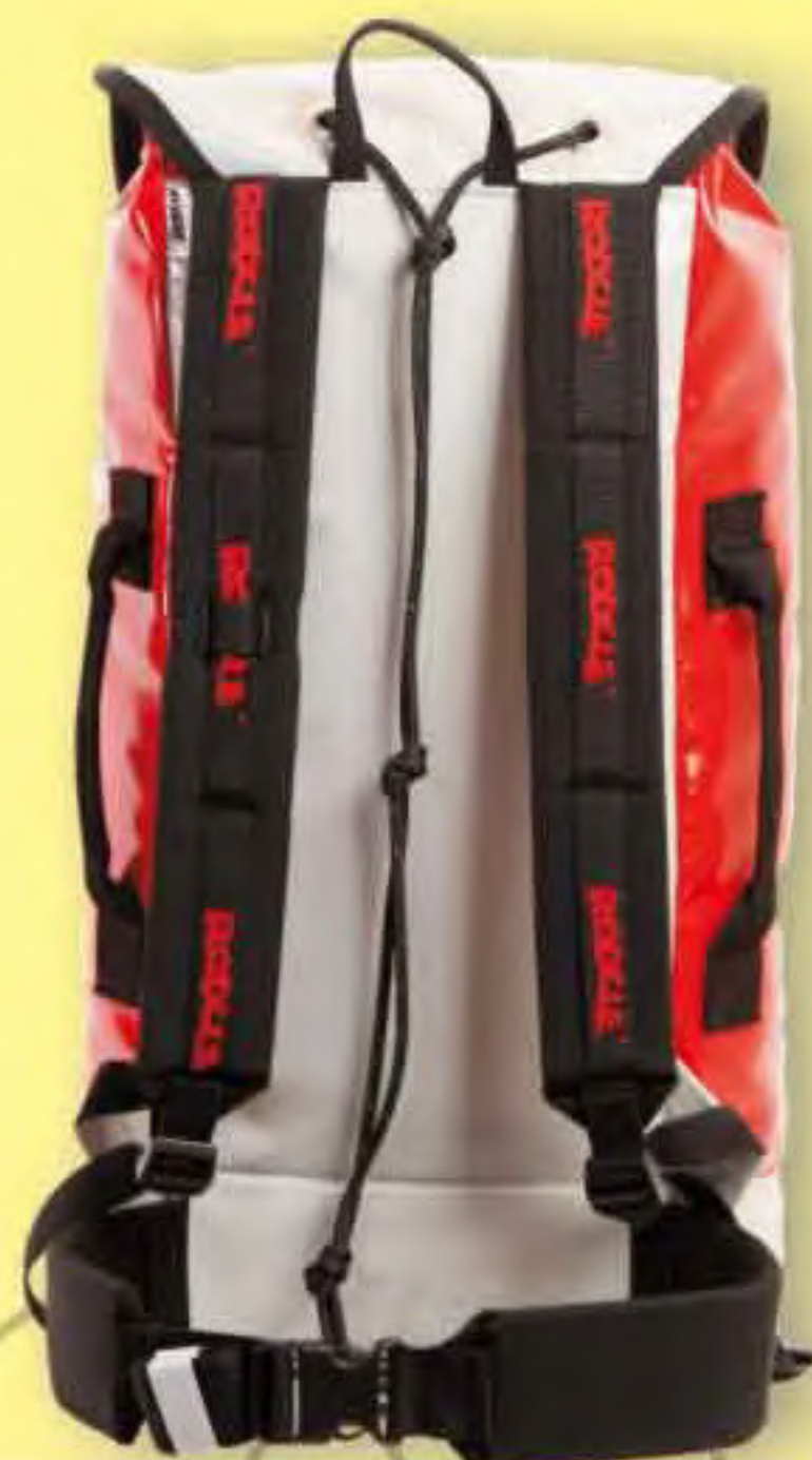
▲ Alba P-541-T Base ∅: 21x30 cm.; H: 61 cm.; Cap.: 41 Lit.