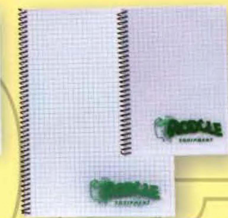
▲ Papel A5