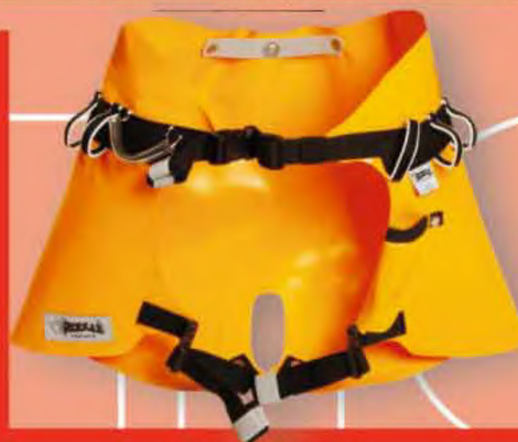
▲ Trou Blanc