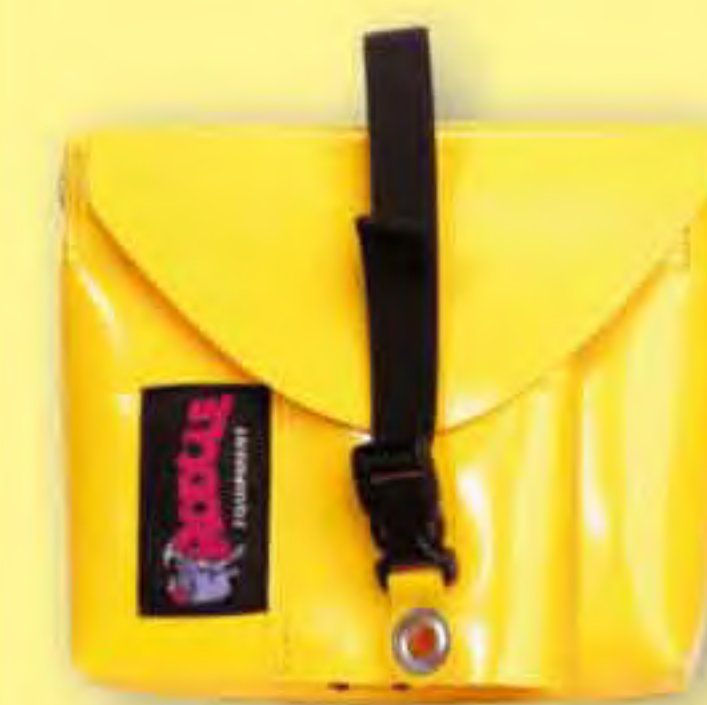
▲ Compacta SACA DE INSTALACIÓN