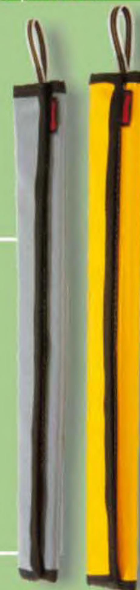
▲ Dual 40 L: 40 cm. HOMBRERA/ PROTECTOR DE CUERDA