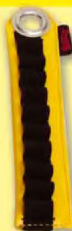
▲ Elastic PORTATACOS