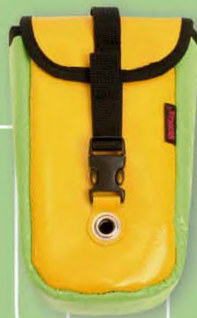
▲ Portacámara Base: 5 x 8 cm.; H: 19 cm. BOLSA ACOLCHADA