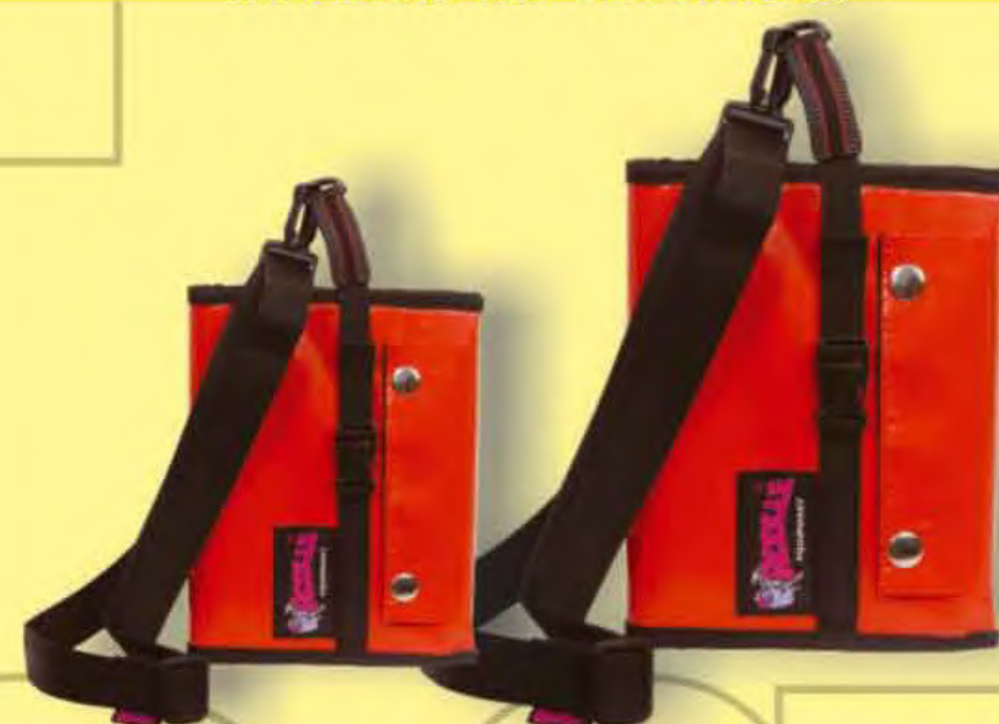
▲ Protector A6