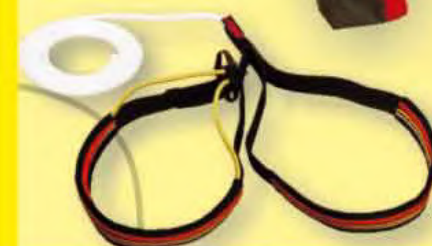
▲ Doble PEDALES ▼ Simple