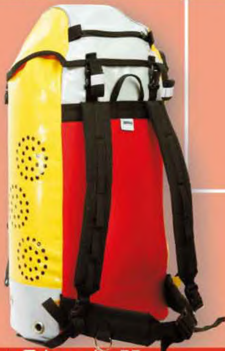
▲ Takamaka 55 Base: 32x29 cm.; H: 68 cm.; Cap.: 55 Lit.