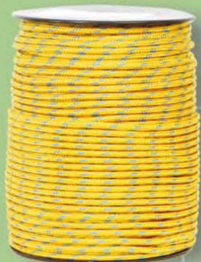
▲ Cordyneema 100 m. Cordyneema 50 m. CORDINOS