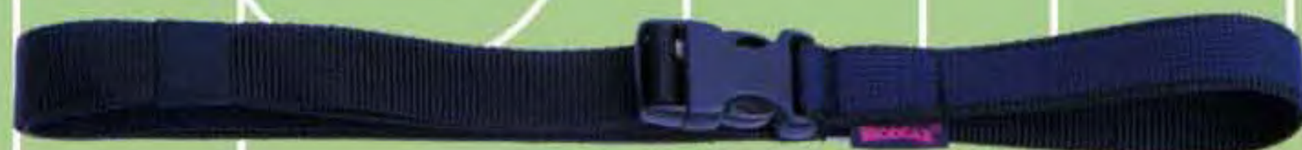
▲ Tridente 120: 2,5 x 120 cm. Tridente 150: 2,5 x 150 cm.