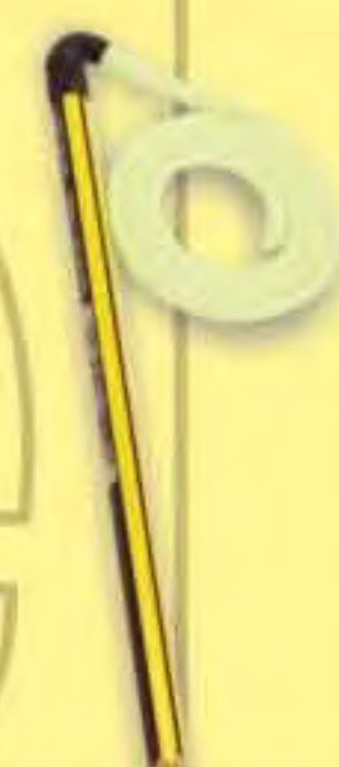
▲ Lápiz con sujeción