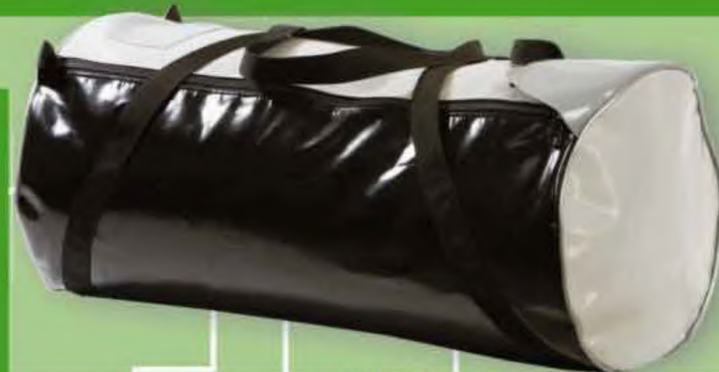
▲ BI 37 Ø: 29 cm.; H: 29 cm.; Cap.: 37 Lit.; L: 61 cm. P: 700 gr.