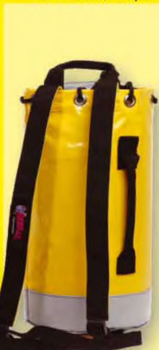
▲ Mini P-119 Base ∅: 23 cm. H: 45 cm.; Cap.: 19 Lit.