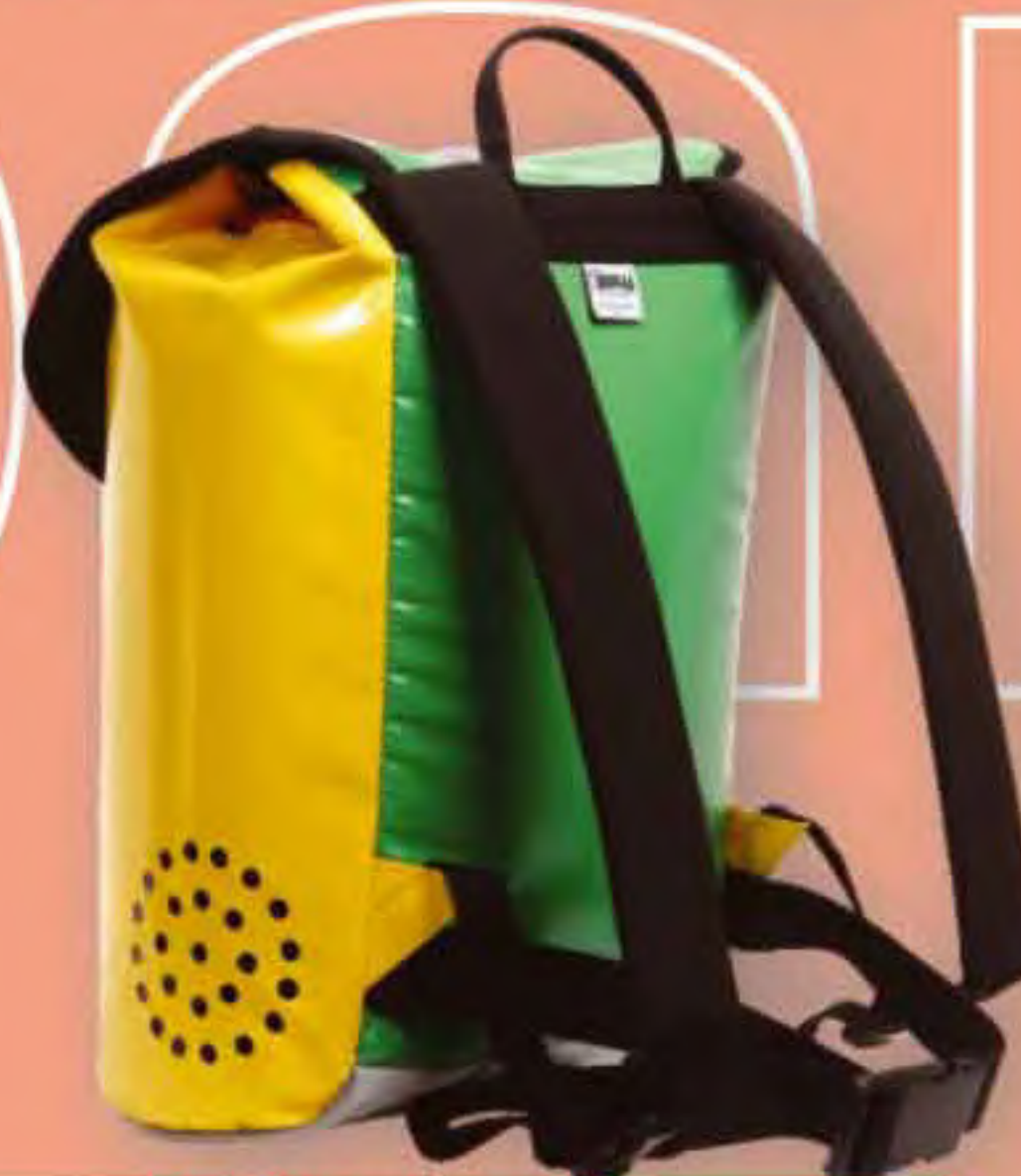
▲ Formiga 25 Base: 30x22 cm.; H: 47 cm.; Cap.: 25 Lit.