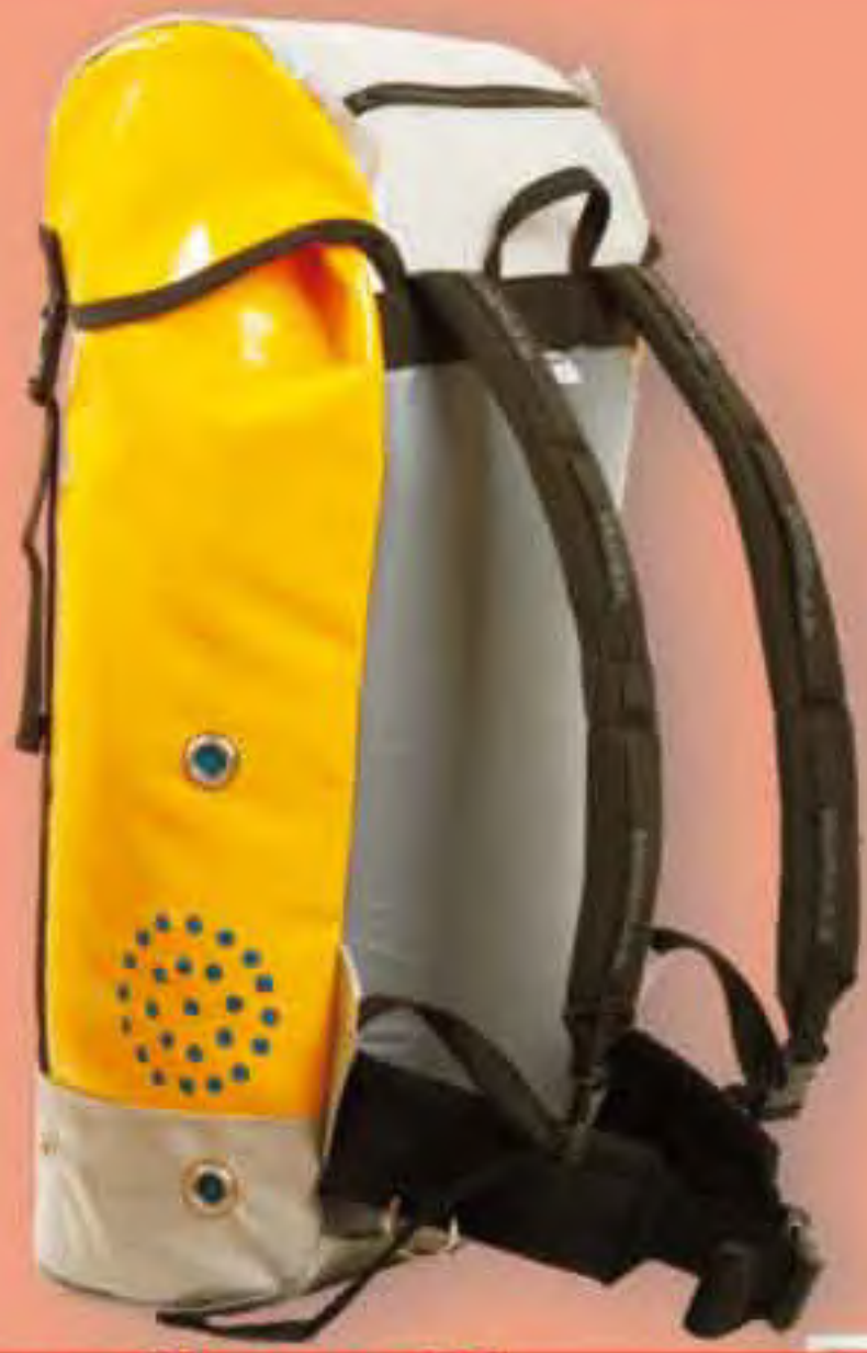
▲ Gloces 35 Base: 30x22 cm.; H: 58 cm.; Cap.: 35 Lit.