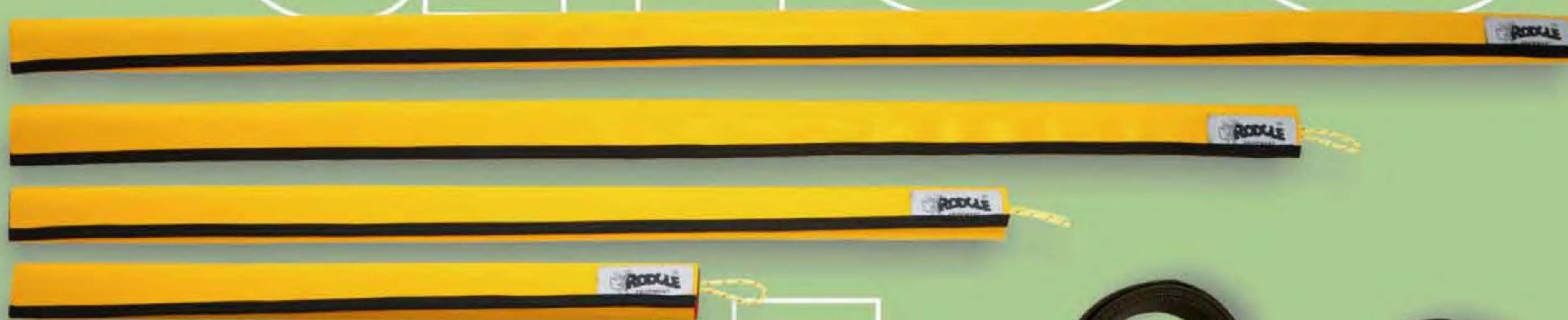
▲ Convencional 30, 40, 50, 60 PROTECTOR DE CUERDA