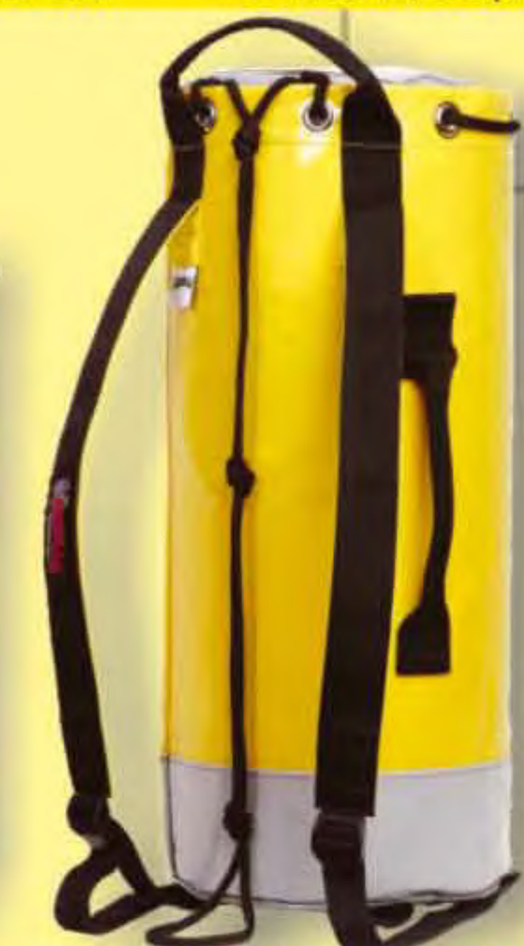
▲ Medium P-224 Base ∅: 23 cm. H: 53 cm.; Cap.: 24 Lit.