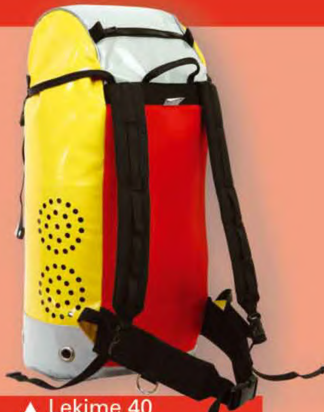
▲ Lekime 40 Base: 31x25 cm.; H: 58 cm.; Cap.: 40 Lit.